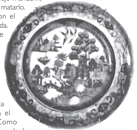
PLATO. Museo de Arte Colonial de Bogotá. Elaborado en la Manufactura PINDER BOURNE & co. Siglo XIX. Diseño del Sauce