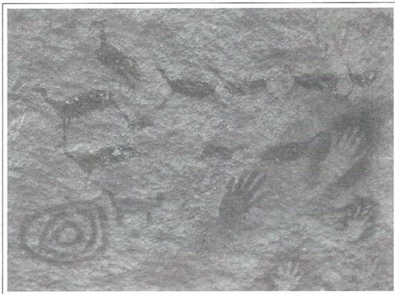
Figura zoomorfa, impronta de manos y círculos concéntricos (América del Norte)

El concepto aritmético de siglo y el de las edades de la historia, han contribuido notablemente a organizar la memoria pues han permitido cierta clasificación sistemática de los hechos. Al mismo tiempo, el modelo historiográfico elaborado por Occidente en los últimos quinientos años, ha sido una herramienta decisiva para la creación de una visión sistemática de la historia, a la vez que ha facilitado los procesos mentales de asociación, mediante los cuales ha sido posible retener e hilvanar una mayor cantidad de información en la memoria colectiva.