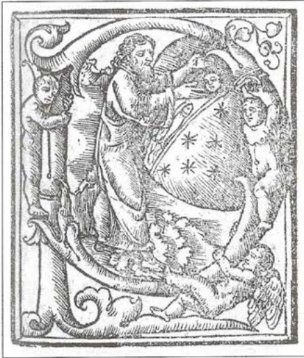
Italia Pontificale secundum ritum sacrosanctae Romanae ecclesiae... Libro impresso (Venecia, Luc Antonio Giunta, 15 de septiembre de 1520)

la melancolía, la beatitud estética . . .