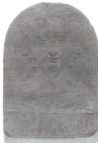
Atribuido al taller de Desiderio de Settignano Alegoría de la Prudencia Arenisca gris, ca. 1460