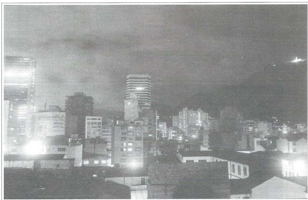
Luces de la ciudad