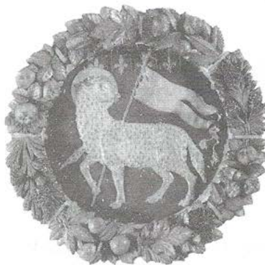
Medallón de terracota Símbolo del Sacrificio Divino y de la Salvación y Enseña del oficio de la lana.

La Invasión a América después de 1492 amplió la actividad comercial, el hombre asiste a una revolución de inmensurables proporciones, así mismo la sociedad se enfrenta a una alteración de las estructuras sociales, culturales y económicas hasta ahora existentes. El hombre se vuelve sujeto de su propio desarrollo, la lucha con la naturaleza y con la organización social estará guiada por los progresos de su conocimiento. El mundo adquiere un orden racional. La magia y lo sagrado son desplazados por la ciencia y lo profano, pero «este desplazamiento no es algo que simplemente se superpone y queda, sino que es un proceso lleno de desgarramientos y retornos que no destruye del