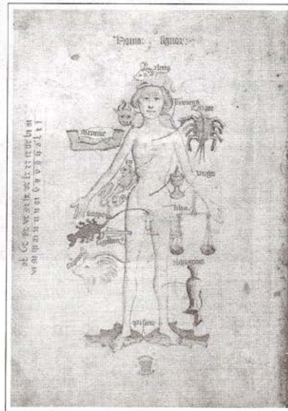
Inglaterra (York) «Hombre zodiacal», del Libro del Gremio de Barberos- Cirujanos Manuscrito, siglo XV.

Por último, debido al desarrollo de las vías de comunicación y de que la tasa de urbanización ha disminuido en algunos países desarrollados, algunos investigadores afirman que los campos se están volviendo ciudades, gracias a la división y a la especialización humana. Todo esto ha hecho que los sociólogos se encuentren interesados en establecer si hay «sociedad urbana» o «comunidad urbana». Camilo Torres, invita a definir «qué tendencia lleva la sociedad contemporánea en su evolución histórica». Por eso concluye: «En mi concepto, la ciudad actual no es sino un fenómeno transitorio, dentro del proceso general de especialización de la actividad humana» 30 .