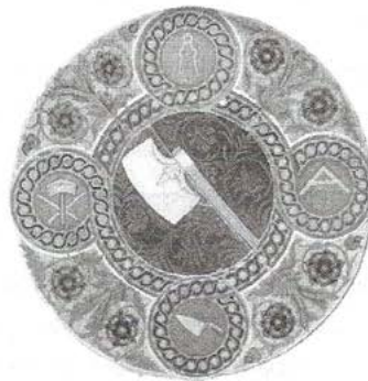
Hacha de carpintero circundada de instrumentos típicos del albañil y del arquitecto (palustre, escuadra, compás) Luca della Robbia, 1400 - 1482

El derecho a la ciudad no puede concebirse como un simple derecho de visita o retorno hacia las ciudades tradicionales, es ante todo un derecho a la vida urbana, transformada, renovada. «Poco importa que el tejido urbano encierre el campo y lo que subsiste de vida campesina, con tal de que lo «urbano», lugar de encuentro, prioridad del valor de uso, inscripción en el espacio de un tiempo promovido al rango de bien supremo entre los bienes, encuentre su base morfológica, su realización práctico-sensible. Ello supone una teoría integral de la ciudad y la sociedad urbana que utilice los recursos de la ciencia y del arte» 14 .