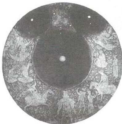
Persia Disco astronómico Grabado de cobre dorado, 1641-66.

Pero hay que guardar cierta precaución en el intento de comprender y estudiar esta difícil relación, ya que por ejemplo, los objetos culturales más sólidos y todas las expresiones de la ideología dominante se han construido en la ciudad, esto para el caso de Francia; pero en nuestro medio, las ideas y las creencias dominantes son un híbrido entre el campo y la ciudad.