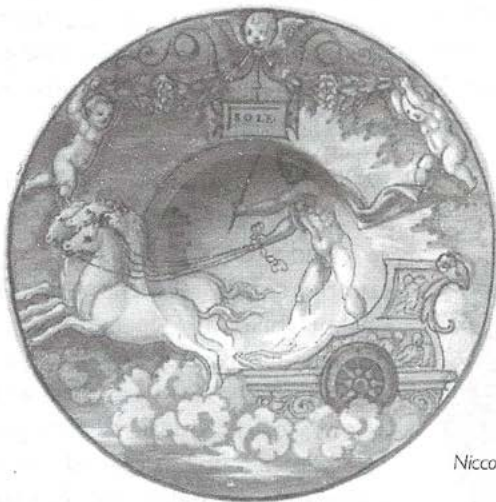
Niccoló Pellipario, Apolo en su carro de fuego

en los conjuntos residenciales. Una dificultad, es que la acumulación de edificios no permite percibir ni reconocer lo poco que queda del espacio público. Pero los actuales procesos económicos han contribuido a la constitución de centros financieros congestionados, caóticos y con mero significado consumista, y una periferia extensa, sin lugares atractivos, significativos y de posible interacción. Un ejemplo de esto, es el Plan de Ordenamiento Territorial para Bogotá (2001) del Alcalde Peñalosa que pretende constituir un gran centro financiero en lo que fue el antiguo centro histórico desplazando a los habitantes «indeseables» -realmente los pobres que resultaron del inacabado proceso de industrialización- a la periferia; además, se necesitan eficaces sistemas privados de transporte como el metro bus -Transmilenio- para desplazar las hordas de trabajadores sin seguridad ni estabilidad laboral que puedan vender su fuerza de trabajo en las zonas urbanas que lo requieren.