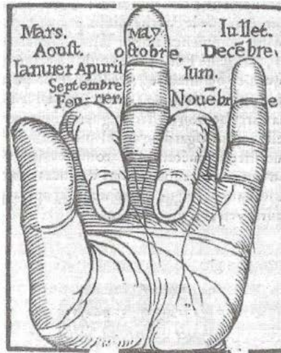
Jehan Tabourot, Comptot et Manuel Calendrier

Por los años de la Conquista de América se desarrollaba en Europa el Renacimiento, en el que se trató de contraponer al urbanismo irregular medieval, calles o espacios regularizados con arquitectura de lenguaje clásico. Regularidad y clasicismo representaban la racionalidad del capital convertida en la nueva concepción del mundo. A algunas plazas con trazos irregulares -como en París- se les incrusta un cuadrado perfecto, como espacio para el descanso, el paseo cortesano y los torneos de caballería. En las construcciones urbanas debía primar la fachada y la apariencia ya que era importante la uniformidad de la intervención urbana, como elemento formal que simbolizaba el espíritu industrial.