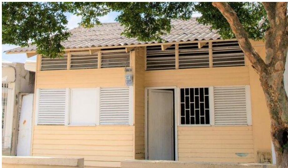
Casa de madera vigente en el barrio Simón Bolívar.