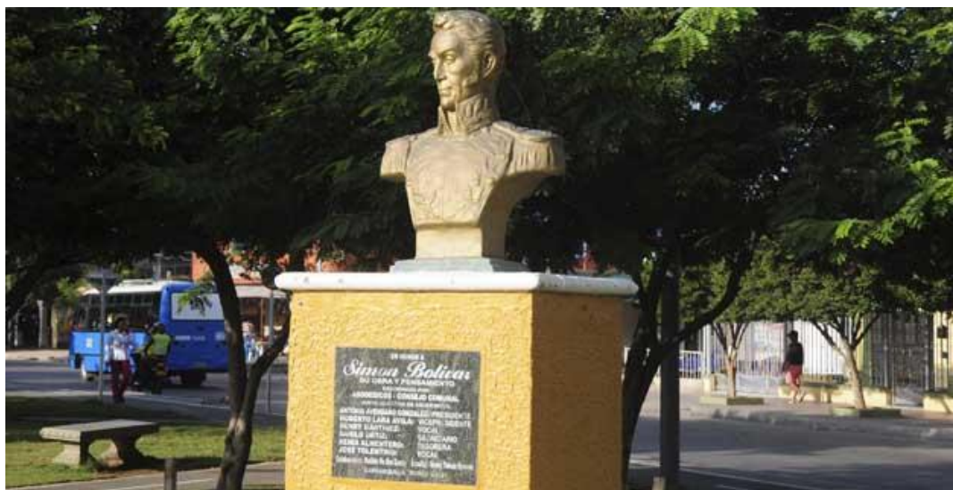
Busto de Simón Bolívar ubicado en el barrio que posee su mismo nombre.

Un hecho característico de su fundación fue el nombre que le asignaron a esta locación, titulándolo con el nombre de Simón Bolívar, insigne personaje de la historia colombiana y de su proceso de independencia, al igual que el de muchas naciones en Suramérica. En honor a ello se encuentra ubicada un busto en medio del boulevard del barrio en mención.