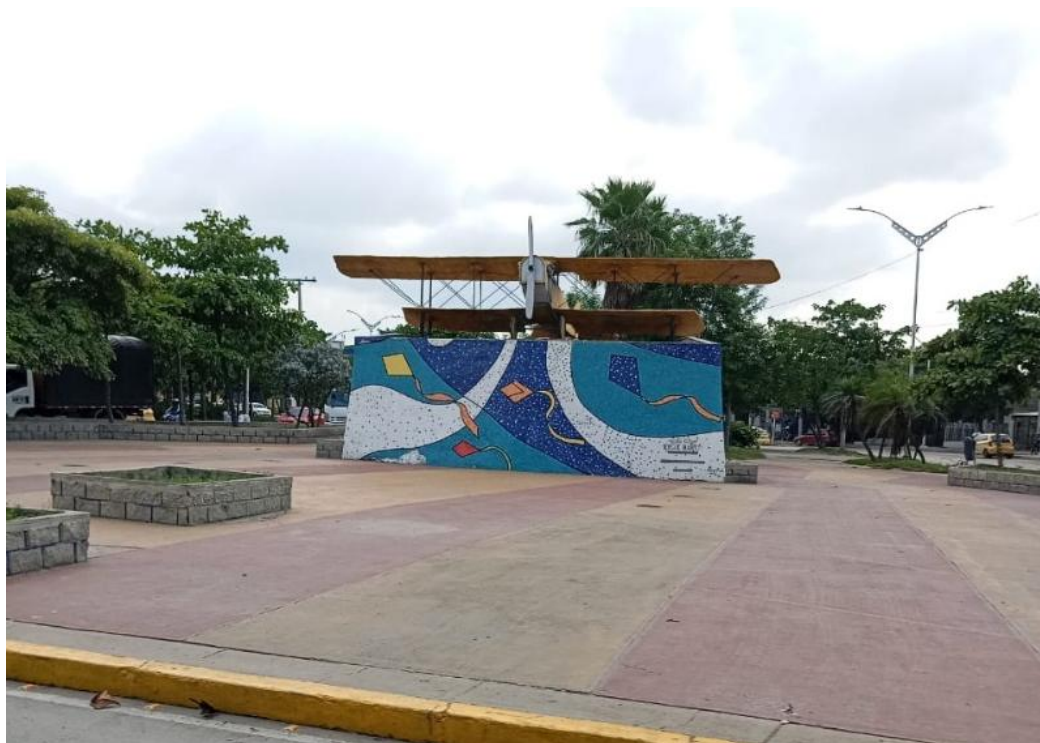
Monumento a la aviación.