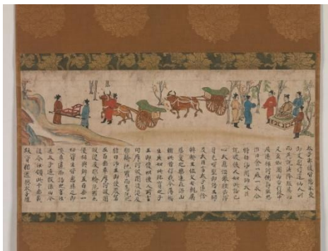
Ilustración 11. E-maki.

En la elaboración de estos rollos se puede evidenciar un primer trabajo de edición en donde jugaba un papel muy importante la imagen y el texto, consiguiendo un lenguaje visual con elementos gráficos dibujados en un rollo y un trabajo manual que empleaba la tinta y el papel como materias primas. Cabe recordar que todos estos procedimientos de ilustración provenían de las técnicas de escritura de los rollos, labores que realizaban los monjes y los miembros de los sectores de la elite de ese entonces.