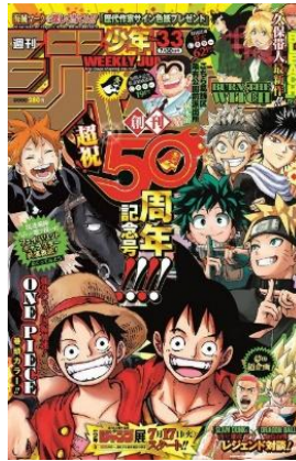
Ilustración 19. Portada conmemorativa por los 50 años de la Revista Weekly Shōnen Jump de la Editorial Shūeisha, una de las más populares entre los lectores de Manga.