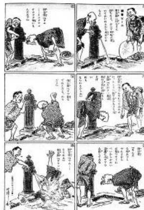
Ilustración 14. Tagosaku to Mokube no Tokyo Kenbutsu , manga de Kitazawa.

entretenimiento en revistas o prensas. Una de las más destacadas fue la revista Japan Punch , fundada por Charles Wirgman en 1862, él era un caricaturista y dibujante inglés que viajó al país del sol naciente para aprender del Japonismo y las artes compartidas. Debido a la enorme popularidad de las nuevas tiras cómicas en la revista se incrementó su publicación, distribución y alcance, el cual se comenzaba a notar con publicaciones en el exterior. El primer manga que tuvo este honor fue Tagosaku to Mokube no Tokyo Kenbutsu (El viaje a Tokio), del mangaka Rakuten Kitazawa, considerado el primer dibujante de manga moderno, que siempre conservó el estilo y técnica del manga desarrollado en su país de origen, recordando el cuidado de sus tradiciones y rescatando el término “manga” que Hokusai había creado.