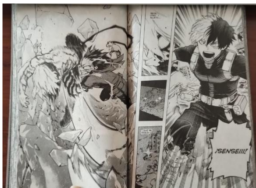
Ilustración 4. Ejemplo de la expresividad del manga. Fotografía tomada del volumen N°29 de My Hero Academia, de Editorial Panini Manga.

En su estilo el manga siempre ha destacado por el carisma y la expresividad que reflejan los personajes, lo que permite a los creadores una mayor libertad de dibujar apegados a la realidad y realizar escenas más detalladas, logrando escenarios muy claros en donde se comprenda lo que sucede y así se creen entornos muy dinámicos.