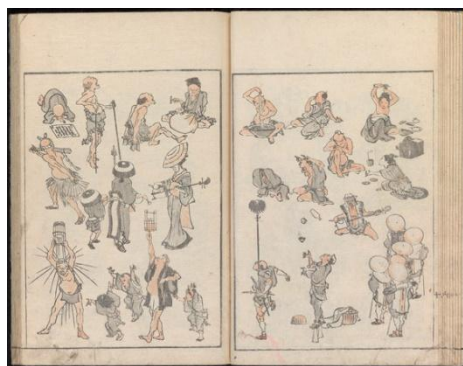
Ilustración 13. El manga de Hokusai.

de posturas artísticas y estilos con ilustraciones narrativas, lo que no predijo fue el éxito y popularidad que este género tuvo, logró una influencia no solo en Japón, sino también en el extranjero, como un modelo artístico para las nuevas generaciones de dibujantes y pintores.