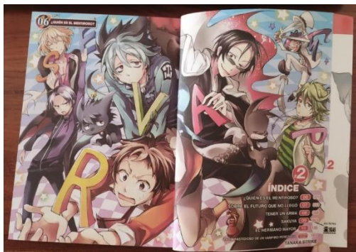
Ilustración 2. Páginas con ilustraciones a color. Fotografía tomada del volumen N°2 de Servamp, de Editorial ECC Ediciones.

tienen color omitiendo la regla del blanco y negro para llamar la atención del lector y ofrecer un lenguaje visual diferente.