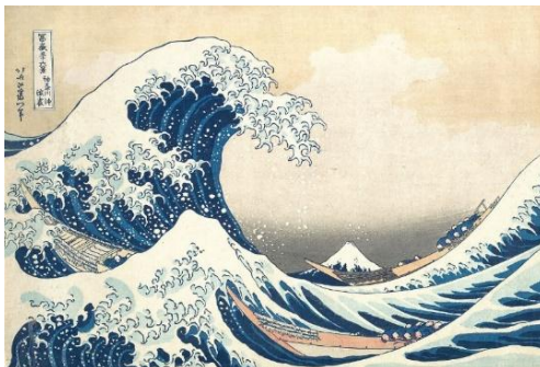
Ilustración 12. La gran ola de Kanagawa, obra del arte Ukiyo-e de Hokusai.

hacer xilografía, no solo por el desarrollo artístico sino por el alcance económico que influía en la época Edo.