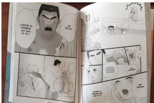
Ilustración 3. Ejemplo del estilo de dibujo.

Por lo general el estilo del dibujo se caracteriza por tener personajes atractivos, con ojos grandes y cabello en punta; estas características son consideradas un estereotipo sobre el estilo, sin embargo, hay casos en los que los mangas, dependiendo del género, se desentienden de esta premisa y crean su propio estilo para crear un lenguaje visual con el lector y una identidad en la obra, por ejemplo, esto ocurre en las historias de terror o amor.