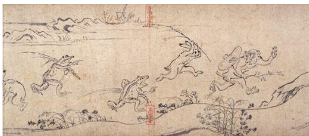
Ilustración 10. Chōjū-giga. Fotografía tomada en línea de Artscape Japan.

Para realizar las ilustraciones, Toba se inspiró en la tradición artística japonesa, la cual usaba animales, en su mayoría provenientes del horóscopo chino, o de animales del imaginario fantástico, a los que personificaba con un matiz paródico y humorístico sobre lo que representaban; en ocasiones trataba sobre las clases políticas, acontecimientos o costumbres culturales, por ende, se puede definir al Chōjū-giga como una ilustración satírica japonesa sobre la sociedad de ese entonces.