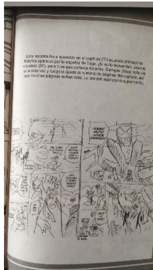
Ilustración 16. Ilustración de un manuscrito inicial anexado al volumen.

los editores puedan definir si es adecuado valorar la obra para ser publicada individualmente.