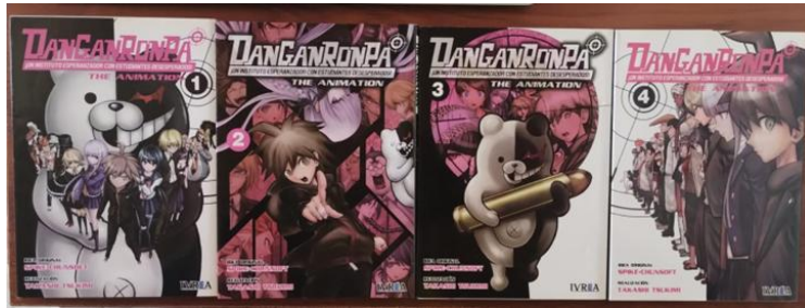
Ilustración 18. Ejemplo de una colección completada de cuatro volúmenes. Fotografía tomada de los volúmenes N°1, 2, 3, 4 de Danganronpa The Animation, de Editorial Ivrea.