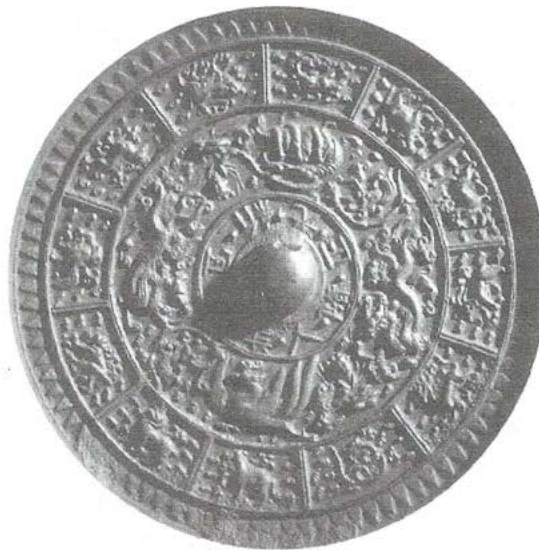
A. van Aken Planetario con el Sol y la Luna. Latón, marfil y papel, siglo XVIII.

Sin embargo, estas afirmaciones pierden contundencia si se las confronta con dos realidades contemporáneas: la globalización, orientada por el mercado, y la existencia de países no industrializados, no occidentalizados o que no han superado el reino de la necesidad.