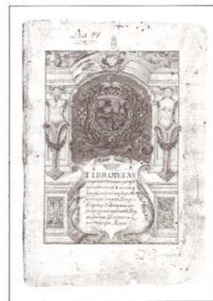
Libro de las longitudes . . . Alonso de Santa Cruz. s. XVI

A comienzos del siglo XVI, el monje alemán Nicolás Copérnico describió en ecuaciones matemáticas en la «revolución de las orbitas», una nueva concepción de la mecánica del sistema solar: La simplicidad y belleza de sus explicaciones, buscaba salvar las apariencias para explicar los eclipses, fenómenos ajenos al modelo geocéntrico sustentado por la Iglesia «a mayor gloria divina». Copérnico fue el teórico que abrió la naturaleza a la razón, recuperando una tradición surgida en Egipto, Mesopotamia y América Central, vertida a occidente por la cultura Helénica - Alejandrina. La simplicidad que sustentaba esta representación matemática del cosmos cautivó a filósofos naturalistas como Galileo Galilei, quien llevó estas ideas al terreno de la observación para argumentar desde la naturaleza, que según Galileo se expresaba en lenguaje matemático; devino entonces el mundo como representación: «Pienso luego existo», afirmaba Descartes 10 . Una nueva filosofía surgía en el contexto del aumento general de ideas que provenía de la reflexión de los filósofos naturalistas.