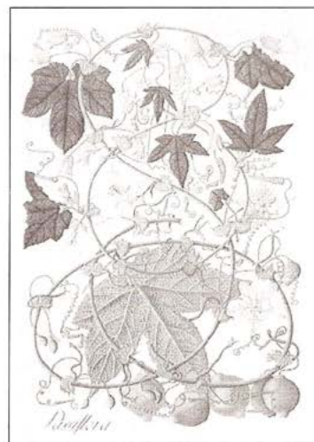
Nueva Granada Passiflora. Real expedición botánica 1783-1816

«Las culturas y las religiones sirven para la construcción de esta secuencia, para la prosecución del tiempo, para la inmortalidad colectiva de los grupos que, por ellas, han creado su tiempo para su creación continua, para la producción de su historia o para su propia reproducción en esta historia.» 3