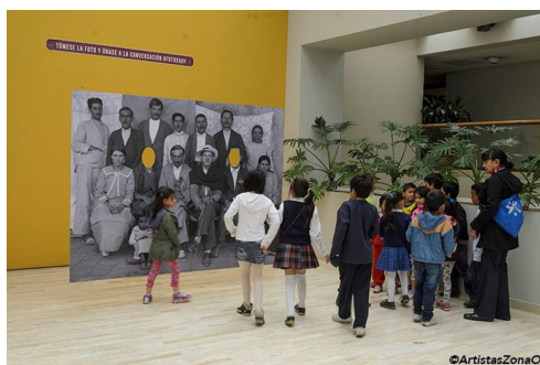
Imagen 4: A contraluz de su propia realidad 27

Desde la imagen gráfica, el poster funcionó como un punto de acceso al mensaje y a la temática de la exposición, ya que no solo era descrita a partir del texto, sino también por medio de la representación de varias personas que mostraban las diferencias socio culturales de los individuos de la época. Al girar hacia las escaleras de acceso a la Sala de Exposiciones Bibliográficas se encontraba una fotografía de la Calle Republicana o Carrera séptima tomada a mediados del siglo XX que fue dividida entre cada escalón, generando una ilusión óptica. Al terminar de ascender la escalera, se veía una fotografía familiar de mediados de los 30', para que el público interactuara de forma didáctica al convertirse en parte de la fotografía.