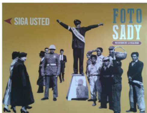
Imagen 3: Bogotá bajo el ojo de Sady (Fotografía) 26

Desde la imagen gráfica, el poster funcionó como un punto de acceso al mensaje y a la temática de la exposición, ya que no solo era descrita a partir del texto, sino también por medio de la representación de varias personas que mostraban las diferencias socio culturales de los individuos de la época. Al girar hacia las escaleras de acceso a la Sala de Exposiciones Bibliográficas se encontraba una fotografía de la Calle Republicana o Carrera séptima tomada a mediados del siglo XX que fue dividida entre cada escalón, generando una ilusión óptica. Al terminar de ascender la escalera, se veía una fotografía familiar de mediados de los 30', para que el público interactuara de forma didáctica al convertirse en parte de la fotografía.