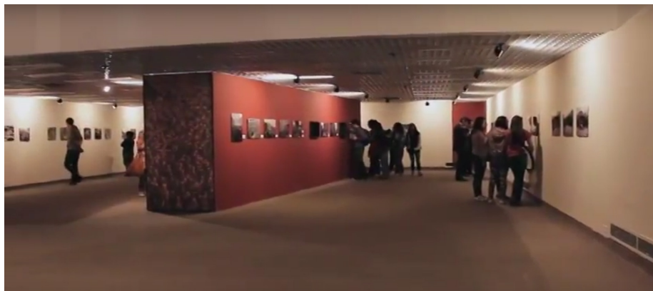
Imagen 7: La máquina del tiempo. Imagen de pantalla 32 .