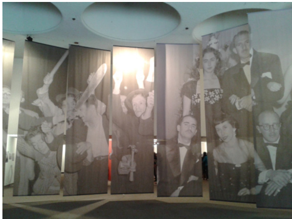
Imagen 6: Bogotá bajo el ojo de Sady González 29 .

El primer eje temático de la exposición se encontraba en la parte sur de la sala que limita con la Hemeroteca. Allí estuvieron exhibidas una serie de fotografías de la década de los 30' donde eran representadas algunas familias de diferentes estratos sociales de la época, la cotidianidad de algunos lugares como Bogotá, Boyacá y Antioquia y la representación de algunos aparatos ideológicos y de control como el clero y la milicia. Estas fotografías revelan diferentes aspectos sociales no solo de las familias, sino de los espacios que eran visitados por Sady que terminarían por revelar "la magia de otros tiempos" 30 .