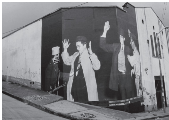
Imagen 2: Exposición El Perseverazo. (Fotografía) 18