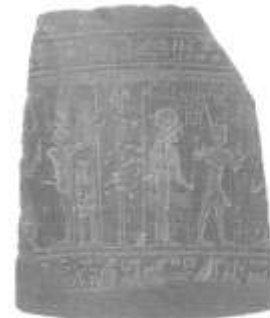
Egipto Fragmento de una clepsidra egipcia Basalto, ca. 320 a. C.