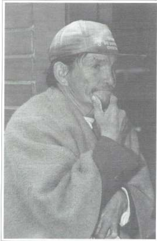
En la tienda de la esquina