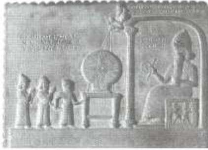
Grecia (Apulia?) Crátera de figuras rojas que representan a Heles saliendo del mar en su cuadrigo. Terracota, 420 a. C.

como centro de su pensamiento. Contrariamente al pesimismo reinante en la filosofía escolástica, en el espíritu de los renacentistas dominó el optimismo. Ellos recuperaron la fe en el hombre, en el futuro brillante de la humanidad, en el triunfo venidero de la razón y de la ilustración. Era lógico, como afirma Alfred Von Martin*, que el nuevo burgués, cuyo éxito se debía a sus propias capacidades y habilidades, creyera incondicionalmente en la fortaleza humana.