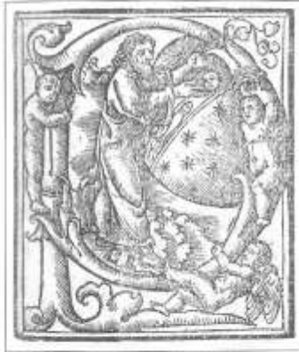
Italia Pontificale secundum ritum sacrosanctae Romanae ecclesiae. Libro impresso (Venezia, Luc Antonio Giunta, 15 de septiembre de 1520)