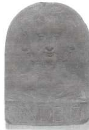
Atribuido al taller de Desideria de Setignano Allegoría de la Prudencia Aterisco gris, ca. 1460