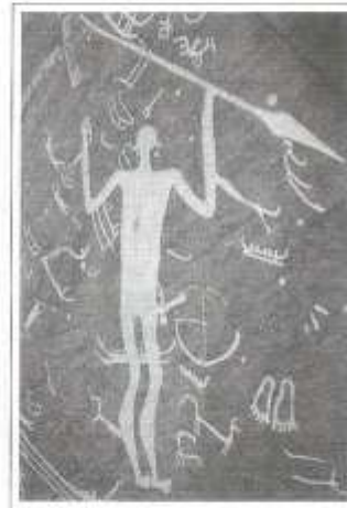
Una incisión rupestre de Tamari (Leksby, Suecia) 1400 a. C.

La primera idea a considerar para entender las razones de la presencia del mito en las sociedades modernas tiene que ver con el hecho de que el individuo de hoy, al igual que el de otras épocas, se siente agobiado ante la perspectiva de un estado de conciencia permanente, y debido a ello inventa subterfugios para escapar; temporalmente, hacia otros niveles de realidad. Pero este descanso momentáneo de su ser histórico no debe entenderse como un acto voluntario, cuya decisión dependa enteramente de él.