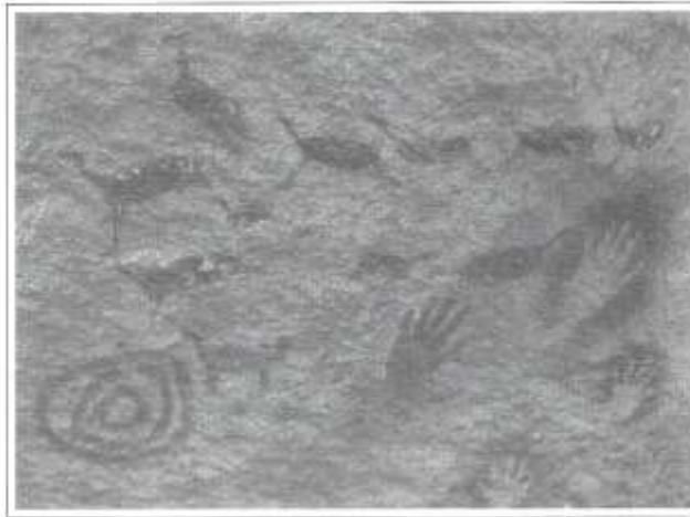
Figura zoomorfa, impronta de manos y círculos concéntricos (América del Norte)

El concepto aritmético de siglo y el de las edades de la historia, han contribuido notablemente a organizar la memoria pues han permitido cierta clasificación sistemática de los hechos. Al mismo tiempo, el modelo historiográfico elaborado por Occidente en los últimos quinientos años, ha sido una herramienta decisiva para la creación de una visión sistemática de la historia, a la vez que ha facilitado los procesos mentales de asociación, mediante los cuales ha sido posible retener e hilvanar una mayor cantidad de información en la memoria colectiva.