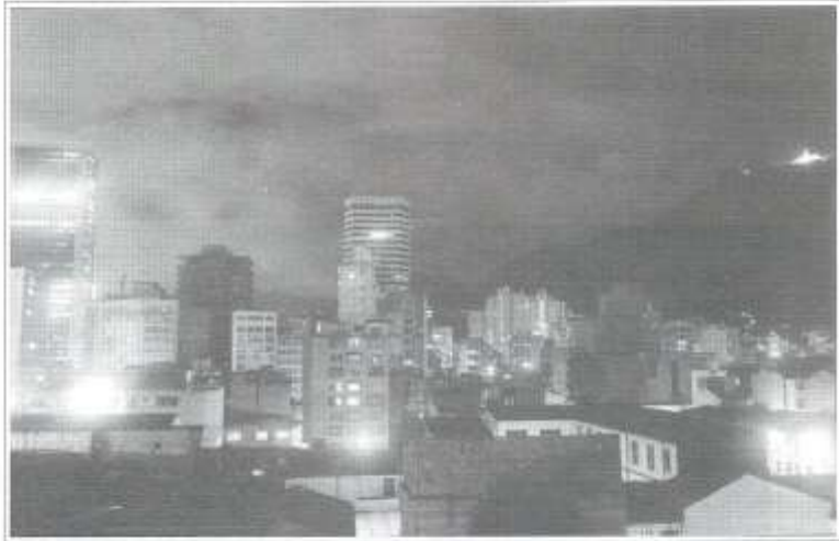
Luces de la ciudad