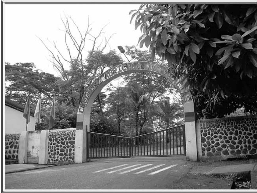
Fotografía tomada el 4 de noviembre de 2011, por el grupo de investigación Cesar Bkria de la Fundación Universidad Autónoma de Colombia.

“La finalidad del castigo es asegurar que el culpable no reincida en el delito y lograr que los demás se abstengan de cometerlo”