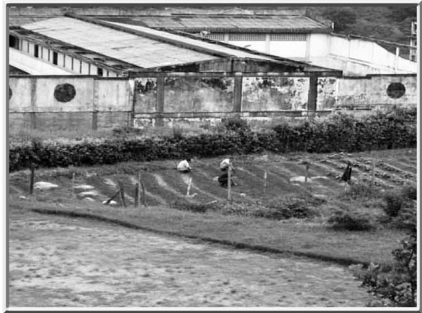
Trabajo extramural desarrollado por los internos de la Colonia Agrícola de Acacías, Meta.