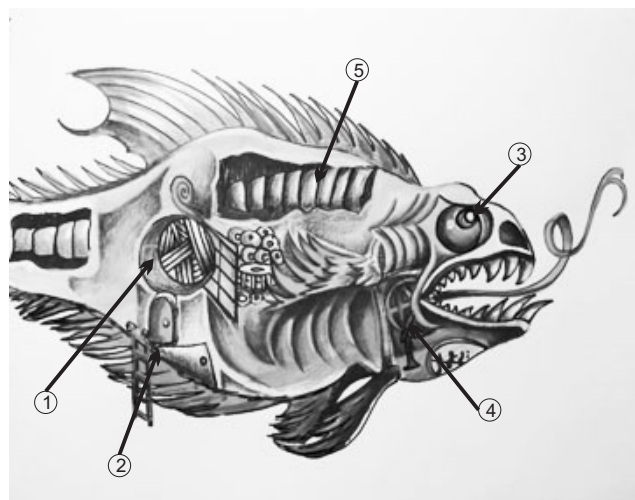
Gráfico 1. Personajes: Pez. Fuente: propia