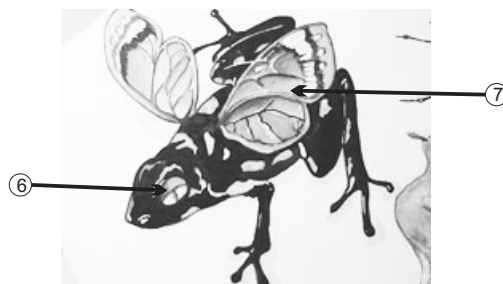
Gráfico 2. Personajes: Sapo.

Detalle 2. Este diseño en particular se repite en este pez, y en el que representa a su primo Felipe. Quienes siempre tienen las puertas cerradas a recibir órdenes, sugerencias o ideas, pero que tienen una escalera que proporciona la esperanza de alcanzar a subir para entrar en ellas.